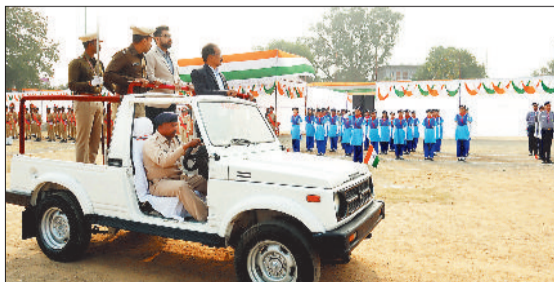
गणतंत्र दिवस की फाइनल रिहर्सल।