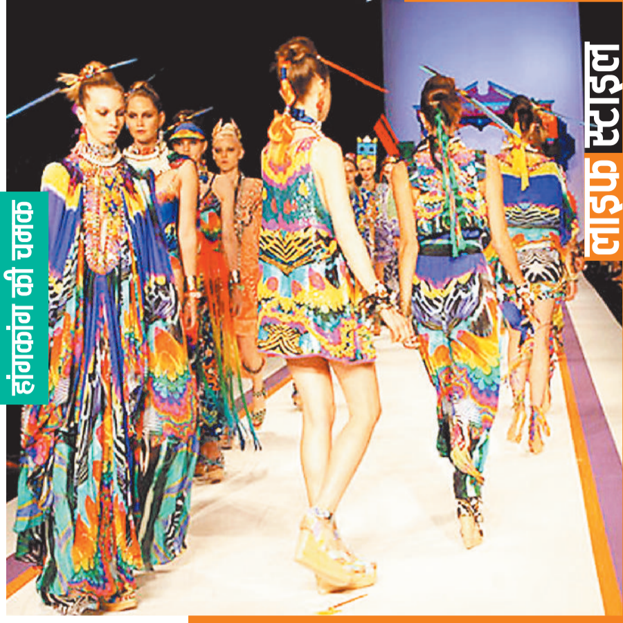
हांगकांग की चमक

फैशन की दुनिया में हांगकांग की अलग चमक है। इस साल एचकेटीडीसी हांगकांग फैशन वीक 20 से 23 अप्रैल तक हांगकांग कन्वेंशन और प्रदर्शनी केंद्र हांगकांग में आयोजित किया जाएगा। जिसमें उपभोक्ता सामान, शहरी परिधान, जूते, कपड़े, फैशन क्षेत्रों से संबंधित अंतरराष्ट्रीय कंपनियों की हिस्सेदारी रहेगी। इसकी तैयारियां जॉरों पर हैं। इस फैशन शो में दक्षिण एशिया का टैलेंट पूरी दुनिया के सामने नुमाया होगा।