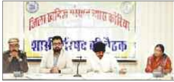
बैठक में उपस्थित विधायक, कलेक्टर व अन्य ।