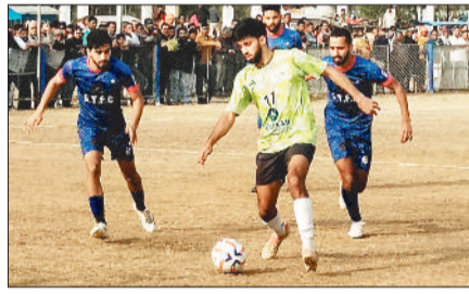
मैदान में खिलाड़ी।