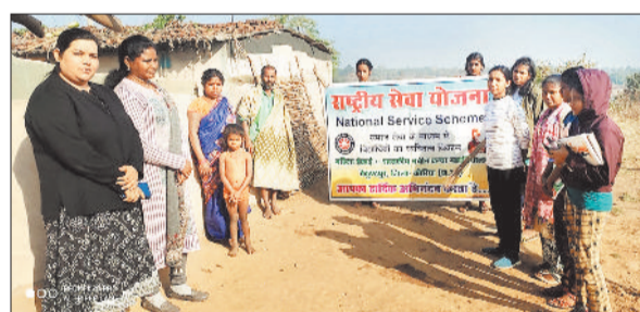
कॉलेज में आयोजित शिविर के दौरान जागरूक करते विद्यार्थी।