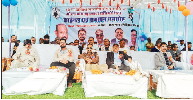
गोल्डकप फुटबल टूर्नामेंट का मैच देखते अतिथि।

अम्बिकापुर। सुबह टहलने निकले सेंटिंग के व्यवसायी ने अपने घर के छत पर स्थित स्टोर रूप में फांसी लगा लिया जिससे उसकी मौके पर ही मौत हो गई। परिजन के मुताबिक व्यवसायी शुगर बीमारी से पीड़ित था और पूर्व में भी फांसी लगाने का प्रयास किया था।