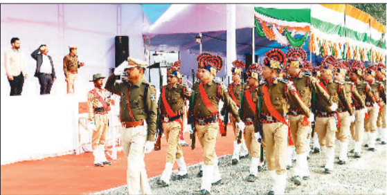
पूर्वाभ्यास के दौरान परेड करते जवान।